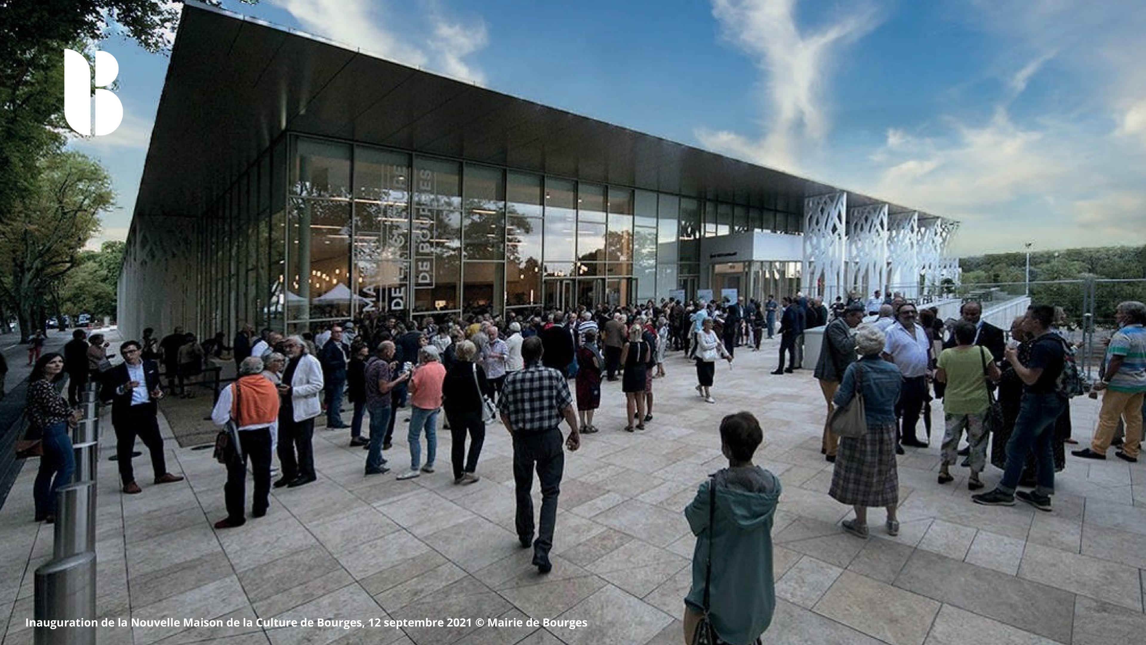
Inauguration de la Nouvelle Maison de la Culture de Bourges, 12 septembre 2021